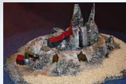
Une île Concession construite par Gauthier