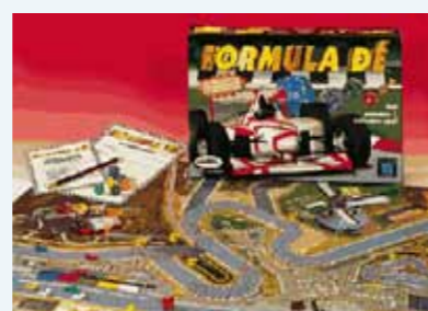
Formula Dé. La Formule 1 à suivre en direct sur Tadefig channel.

Stratégie et tactique sont des aussi des ingrédients que l'on retrouve dans certains jeux de plateau essentiellement destinés aux familles. Vous les retrouverez également au programme de nos après-midis dominicaux car, ne l'oublions pas, Tadefig s'adresse aux jeunes de 8 à 78 ans (nous avons dû upgradé la formule consacrée afin d'éviter un procès avec la firme d'un certain Moulin dans la Sarre). Parmi les grands classiques : le jeu de Go, Formule Dé (aujourd'hui devenu Formula Dé), Mono-Poly... Et pourquoi pas le 1 000 bornes ? Une liste loin d'être exhaustive, vous vous en doutez.