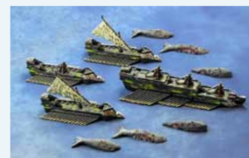
Eh oui, les baleines zombie, ça existe!