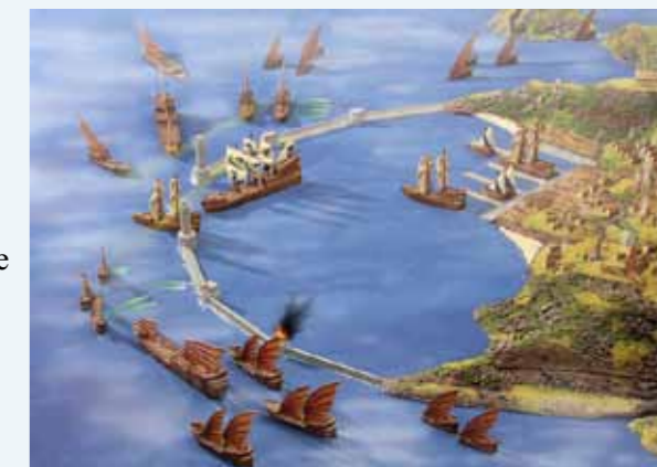
Attaque d'un port humain par un flotte de Dragon Lords

Au début, même si on se perd un peu dans le livre des règles, on y retrouve rapidement son chemin après une exploration approfondie et un peu d'exercice pratique. Au final, Uncharted Seas propose des règles simples et efficaces qui vous permettront de prendre du bon temps. Et la sortie toute récente de la deuxième édition des règles ne fera qu'accroître cet agréable sentiment. Sans oublier l'option, de faire durer le plaisir en posant le pied sur les terres inexplorées des Uncharted Lands , le jeu terrestre de figurines 28 mm extrait du même univers.